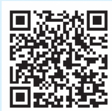
ふなばしパートナーシップ宣誓制度