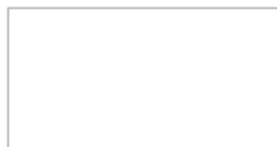
東京学館船橋高等学校での出前講座の様子