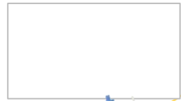
大田区での視察の様子