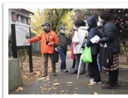
歴史散策～街歩きイベント～