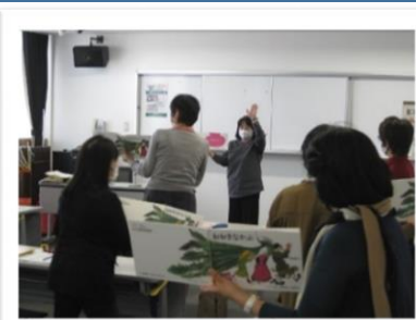
読み聞かせボランティア入門講座

「子供が読書の楽しさに気づき、自ら読書を楽しむことができる環境づくり」について、「第三次船橋市子供の読書活動推進計画」をもとに進めていきます。