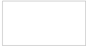
船橋商工会議所での視察の様子