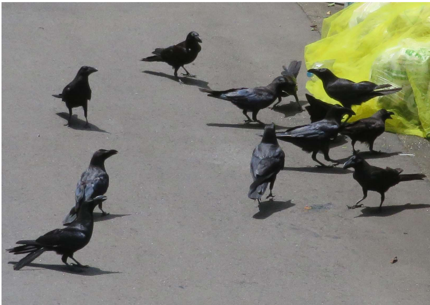
タイトル:カラスとゴミ集積場