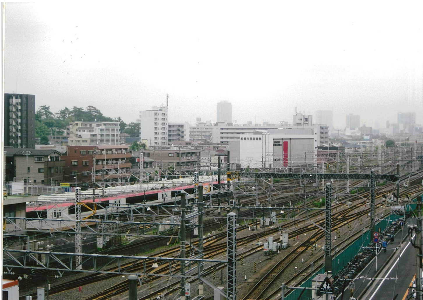
タイトル:朝の西船橋駅