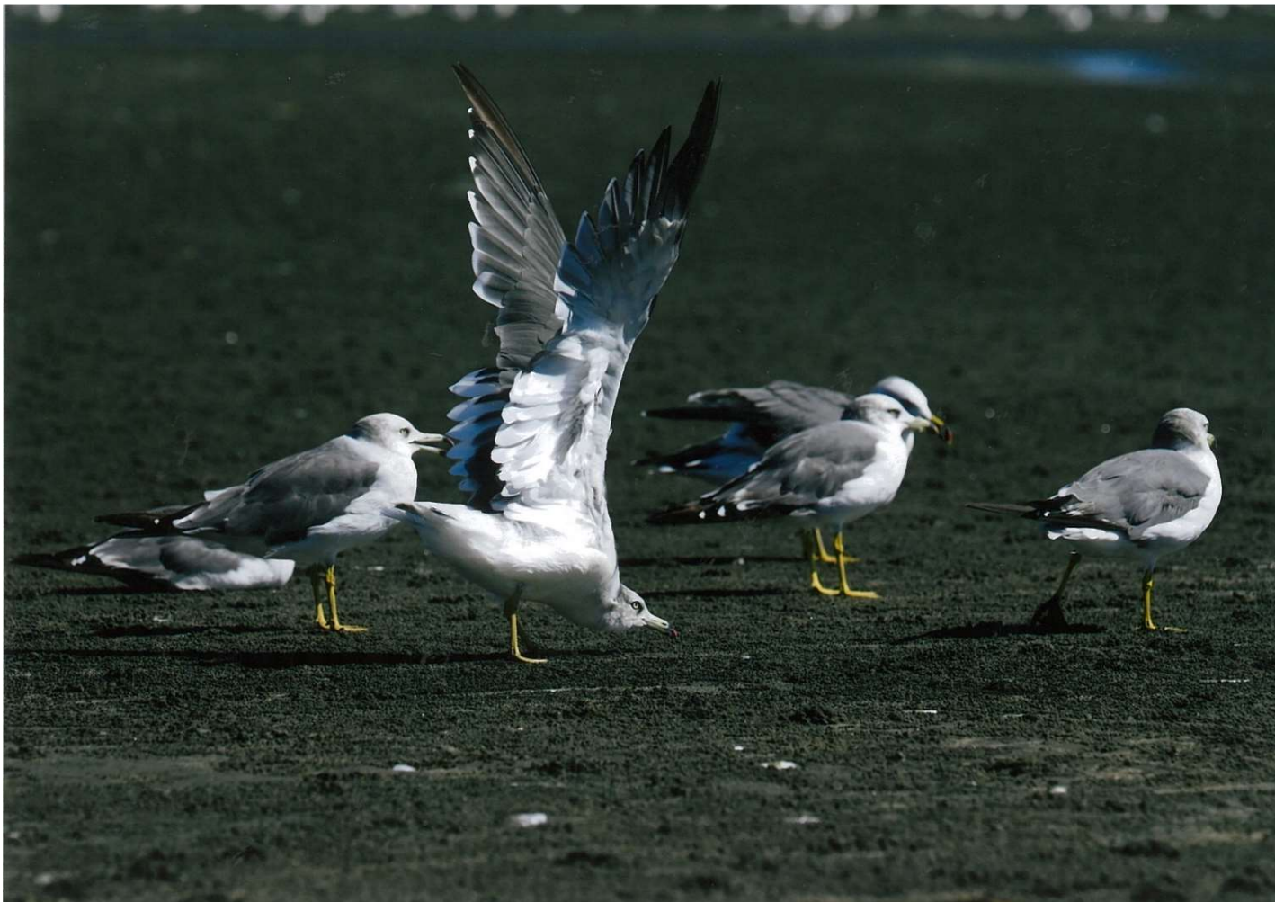
タイトル:精悍なウミネコ