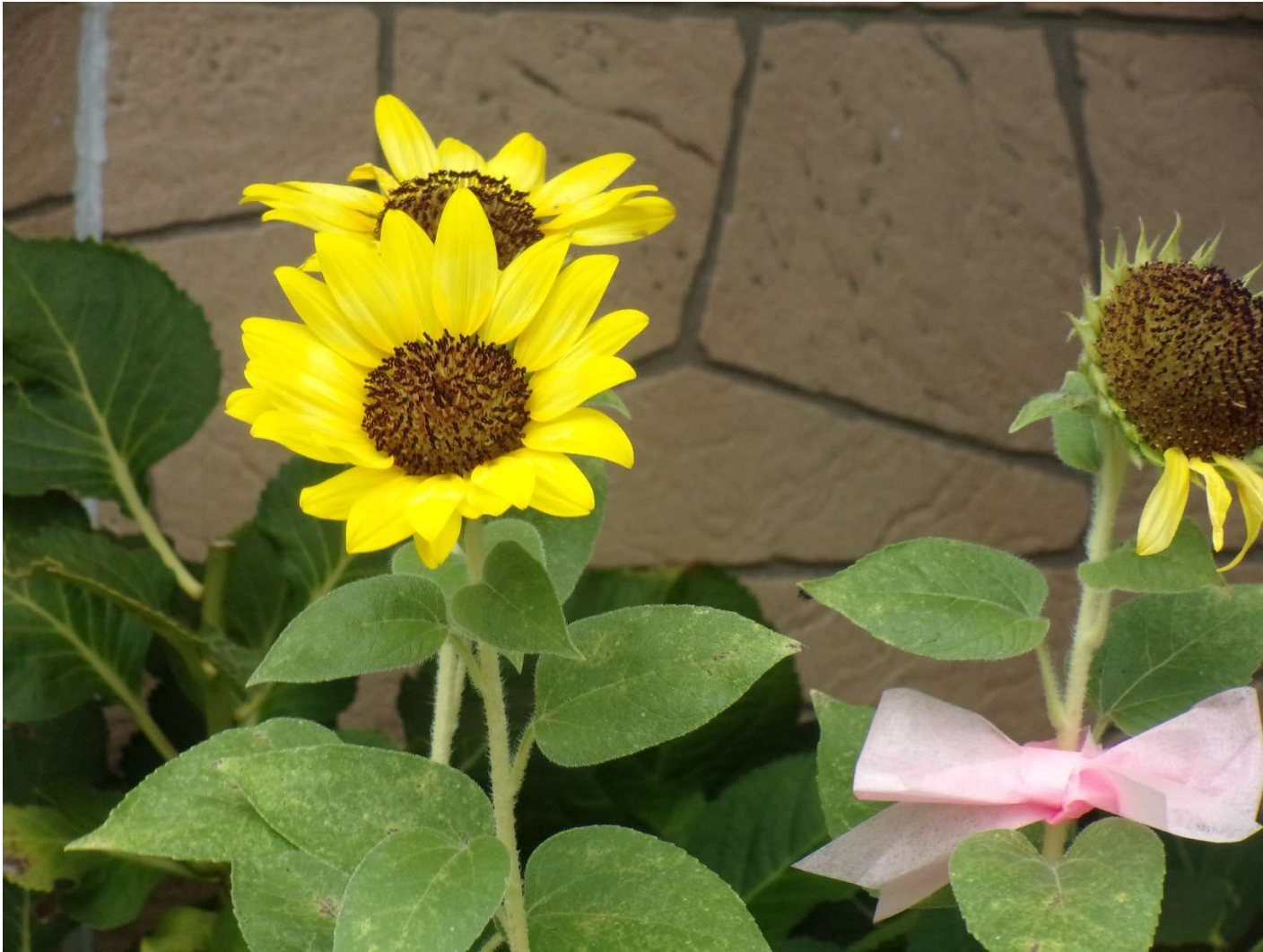
タイトル:公園の向日葵