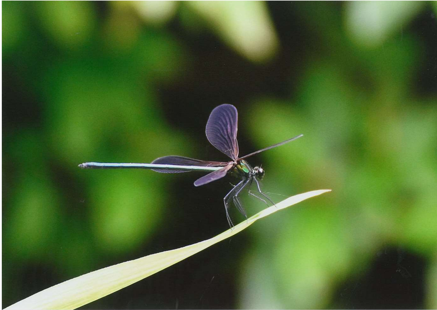
タイトル: 笹藪を好むハグロトンボ