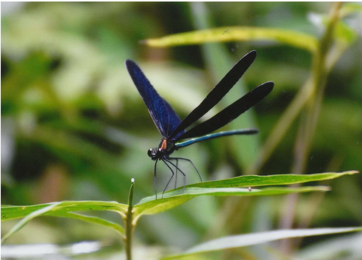
タイトル: 清楚なハグロトンボ