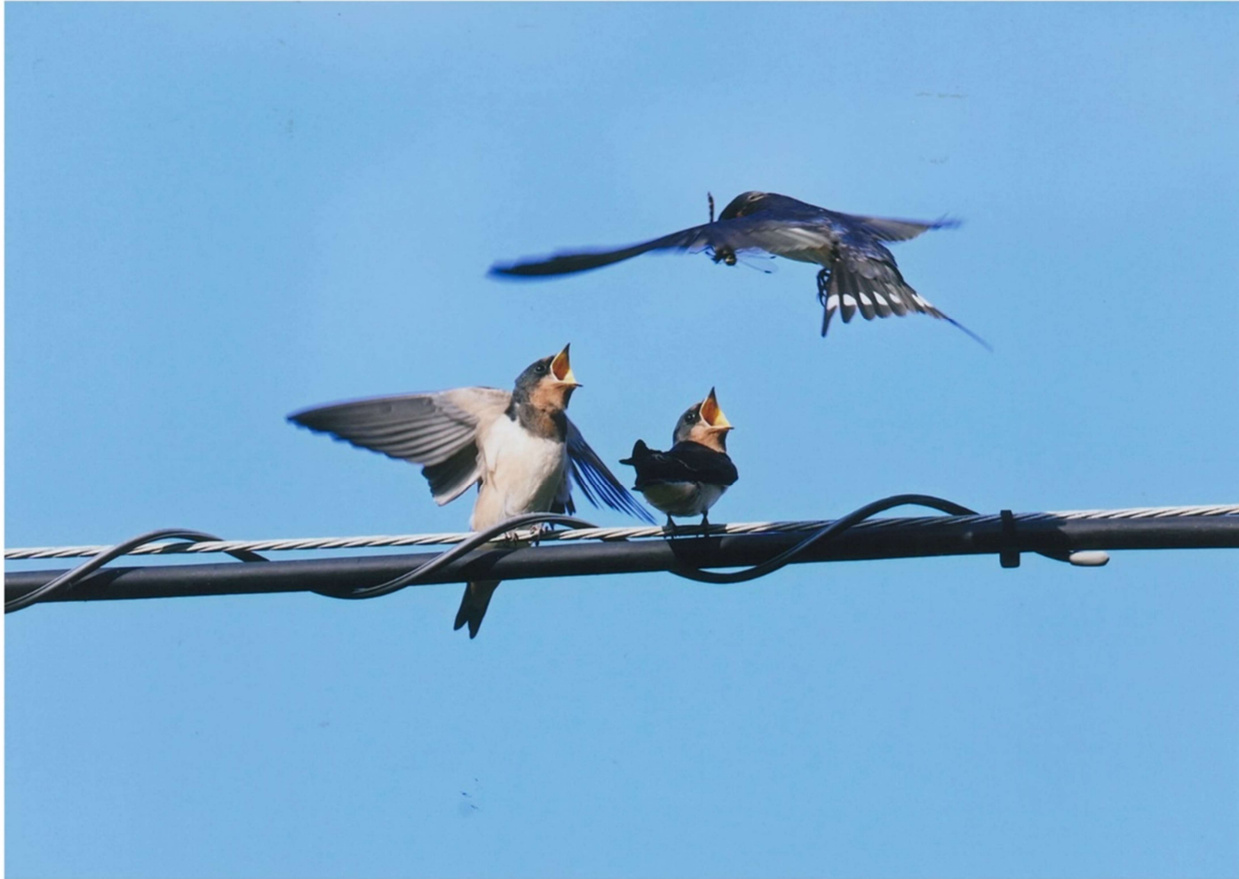
タイトル: 歓喜の巣立ち