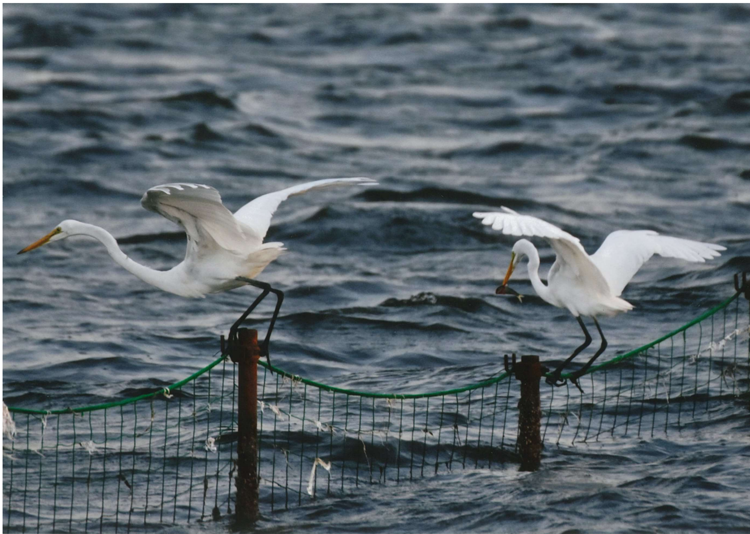
タイトル:夕暮れの三番瀬