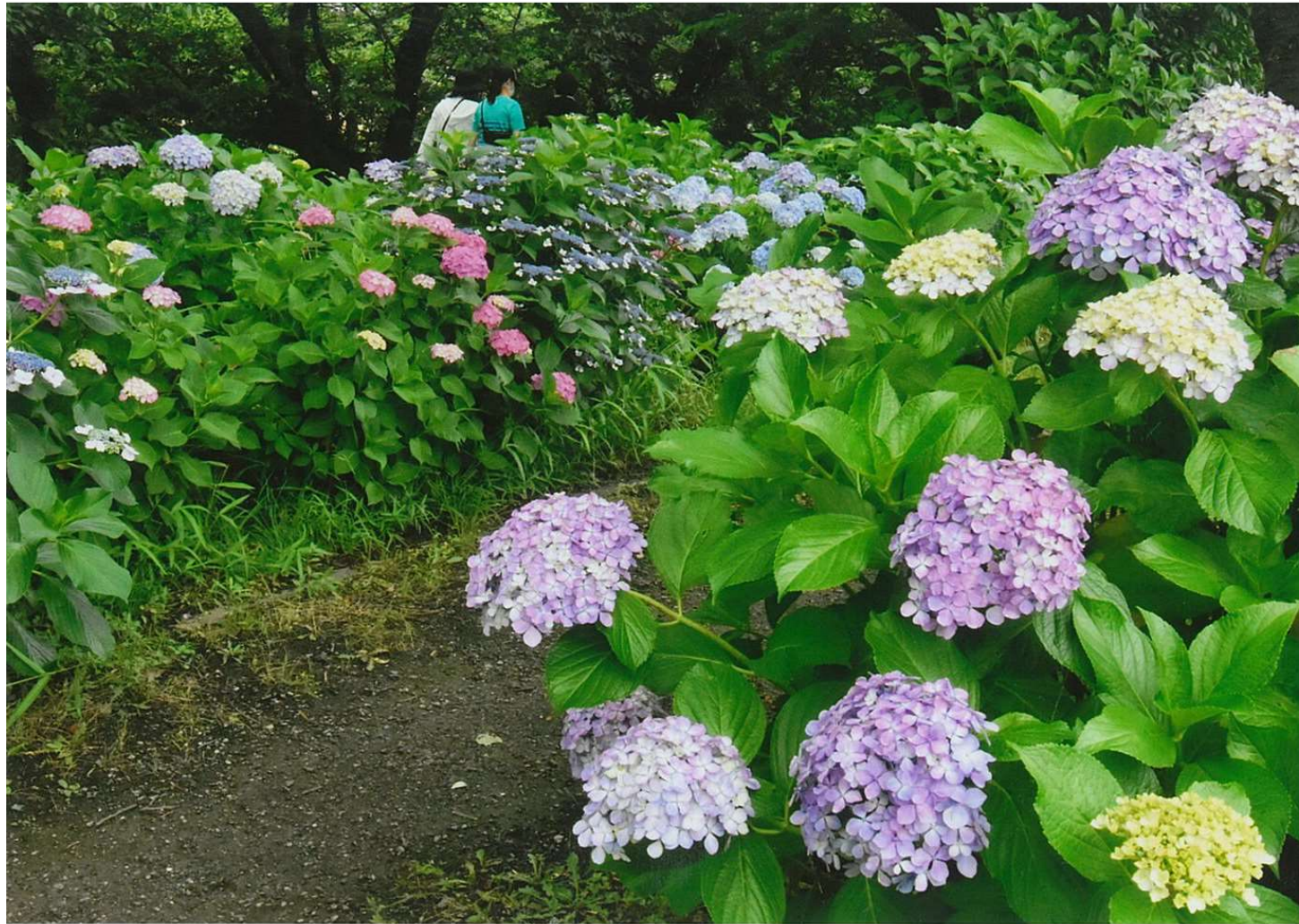
タイトル:爽やかな遊歩道