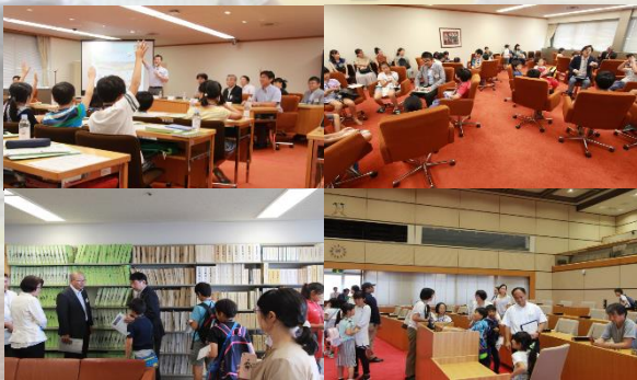
(写真は令和元年度の様子です)