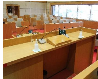
演壇(議員が話をするところ)