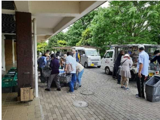
小室ハイランド A-5 号棟