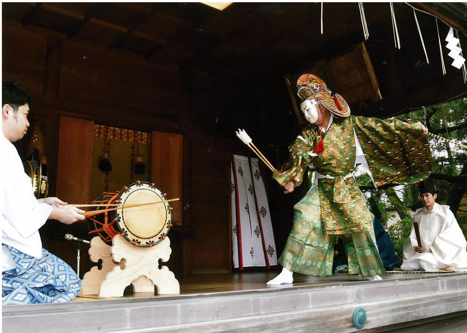
タイトル:秋の例祭(知之里舞)