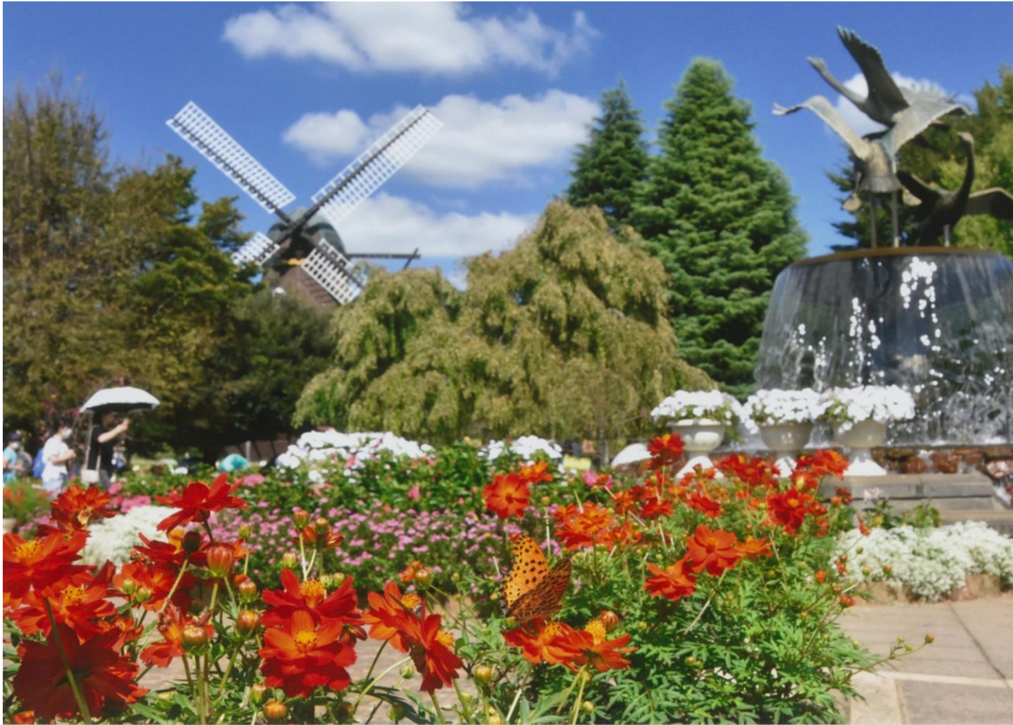
タイトル:キバタコスモスの秋